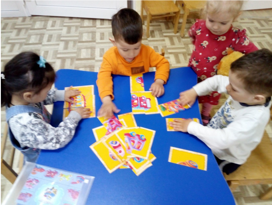
Закрепление игры во второй половине дня.